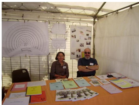
Figure 2 Forum de l'Isle

A la mi-septembre, nous étions partenaire de la semaine des Archives Départementales de Vaucluse, pour l'exposition "En quête sur la toile", les conférences ont été assurées par le CGV, les membres des AD84 et d'autres intervenants, et ont rassemblé les passionnés de généalogie.