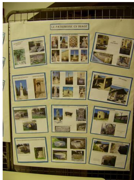
Figure 6: Le patrimoine en Image