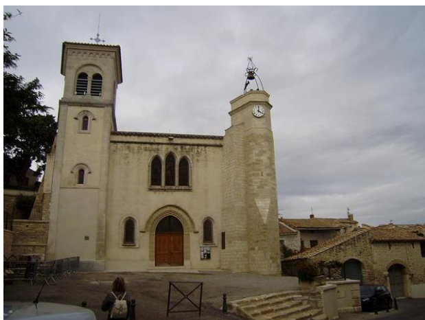
Figure 5: église St-Jacques

En photos, quelques moments de ces journées, à retrouver sur le site.