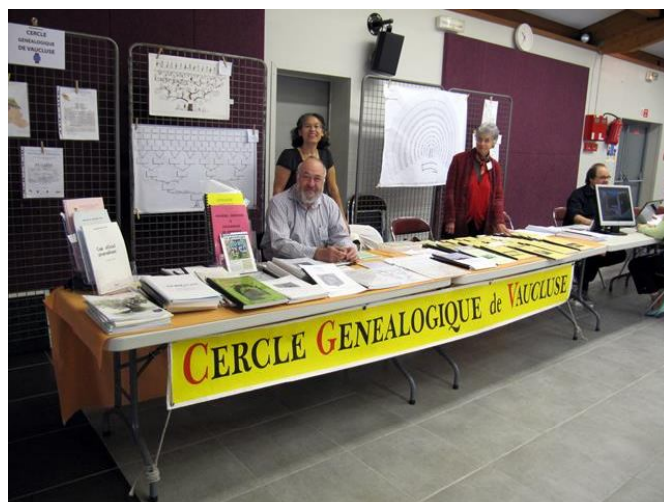
Figure 8: le stand du CGV