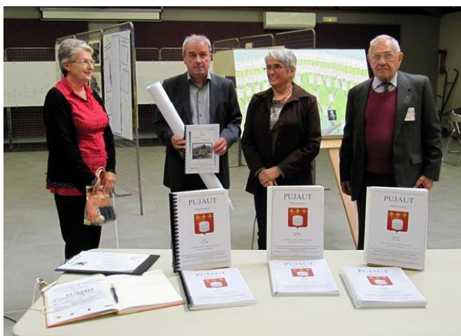
Figure 7: Remise des relevés