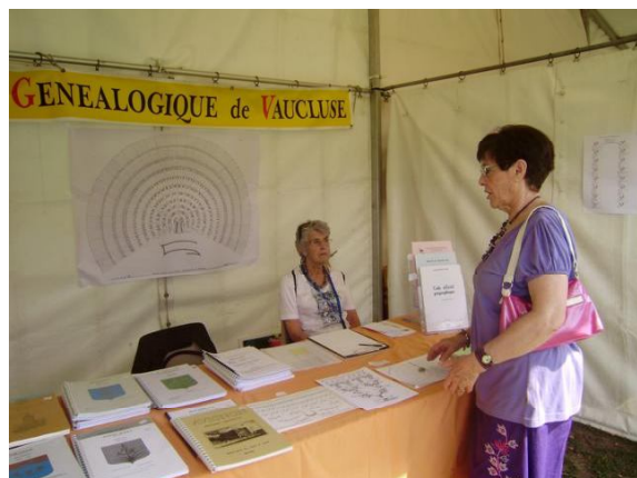
Figure 1 Forum d'Avignon

En septembre, le Forum des Associations d'Avignon, puis celui de l'Isle-sur-la-Sorgue, nous ont permis de faire découvrir nos activités au public, et d'échanger sur les différents aspects abordés lors d'une recherche généalogique.