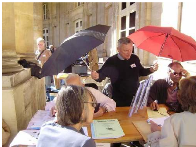
ph 2 Beau temps à Paris, il faut protéger les écrans